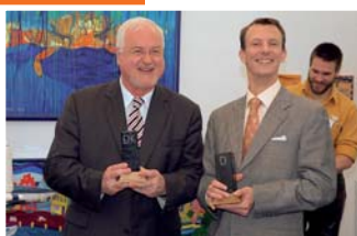
Der Empfang im Künstlerzelt.